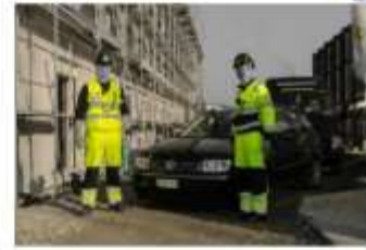
Sie und wir. Zuverlässig und kompetent

Einsatzgebiet: Ganze Schweiz Schnelle Reaktion, dank ausgearbeiteten Kontaktformularen und 24 Std. Pikett, Erreichbarkeit Kurze Anfahrt, kein ständiges wechseln der Mitarbeiter Regional sehr stark verbunden, aus der Region für die Region, Ortskundig Mehrwertsteuerpflichtig, Handelsregistereintrag als GmbH Bewilligungen Kantonspolizei, Zertifikate für die Verkehrsregelung