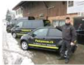
amtlich bewilligt. Mehr Sicherheit für Kunden