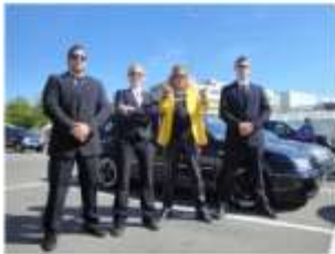
Wir mit uns. Mit Ehrlichkeit durch das Leben